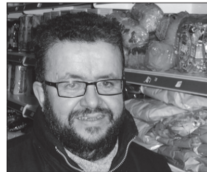
Mesut en Souel: Samen op de bres voor Midzuidershof (11 maart 2009). Nederlanders vinden de weg naar de 'Marokkaanse winkel' in Panmingen (3 februari 2010)